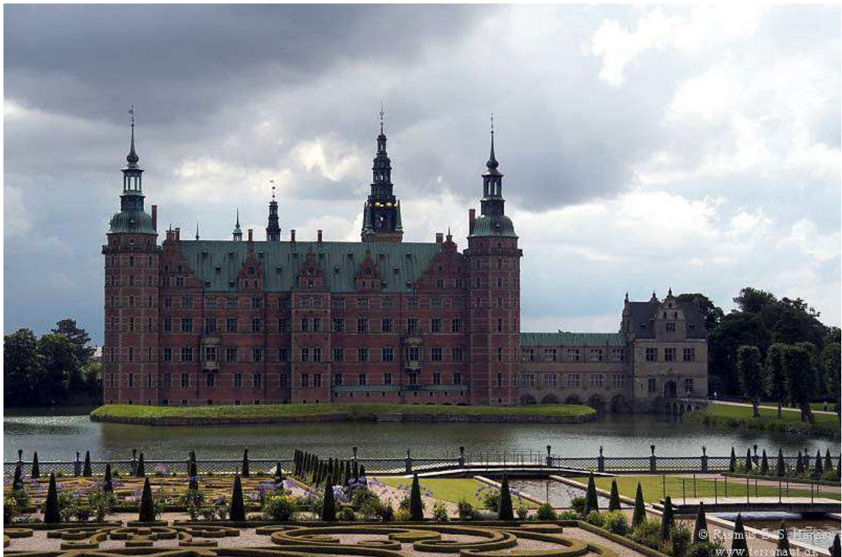
ein berühmtes Schloß in der Nähe von Gurre – wo ist Hamlets Geist?

Oh, wenn des Mondes Strahlen leise gleiten, und Friede sich und Ruh' durch's All verbreiten: nicht Wasser dünkt mich dann des Meeres Raum, und jener Wald scheint nicht Gebüsch und Baum.