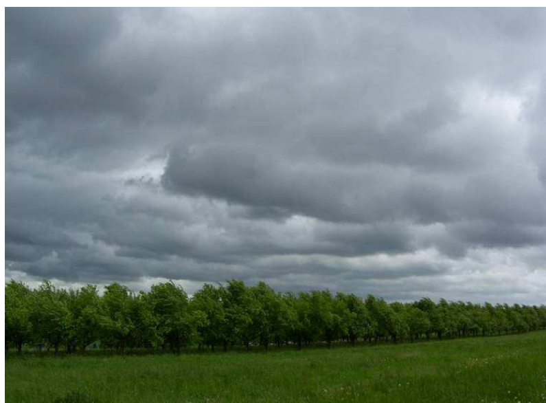
vor dem Sturm/Regen...