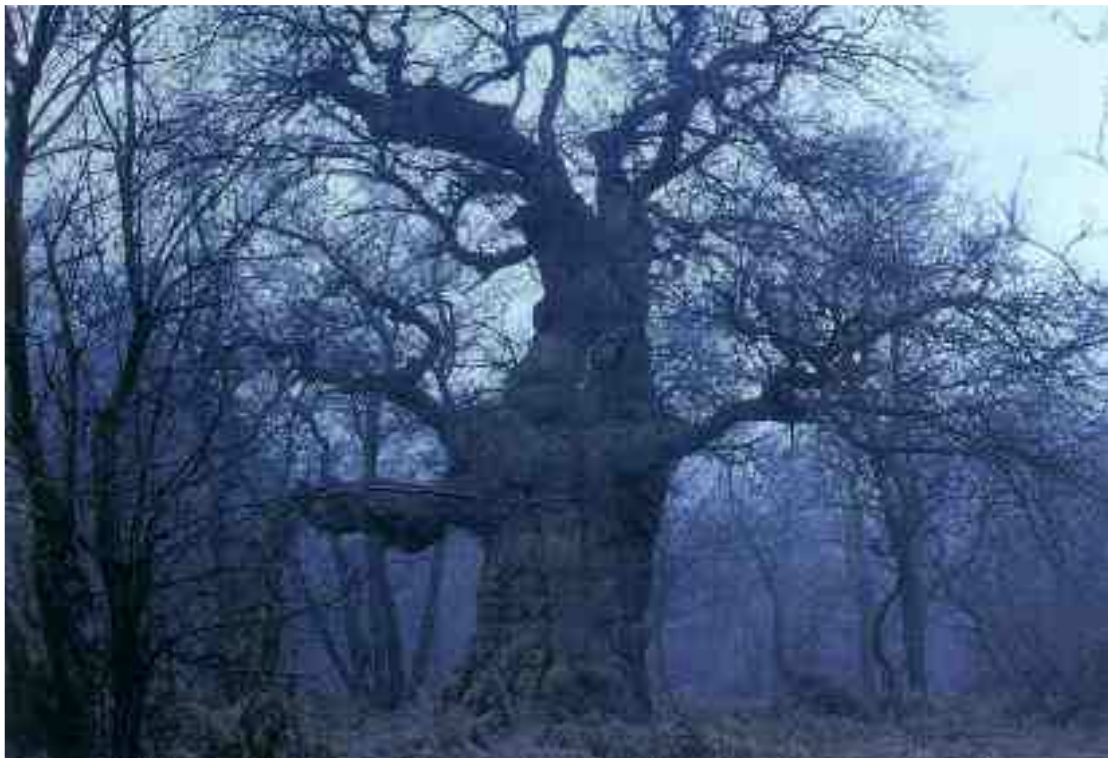
die (mir so liebe) „Blaue Stunde“ ((Vor-)Dämmerung: „...nun dämpft die Dämm’rung jeden Ton von Meer und Land...“ (s.o. Text (Beginn)))