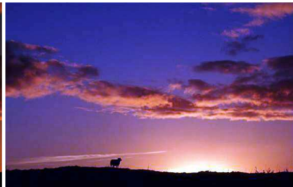
links: Schaf bei Gurre in der Abenddämmerung – rechts: Schaf bei Gurre in der Morgendämmerung