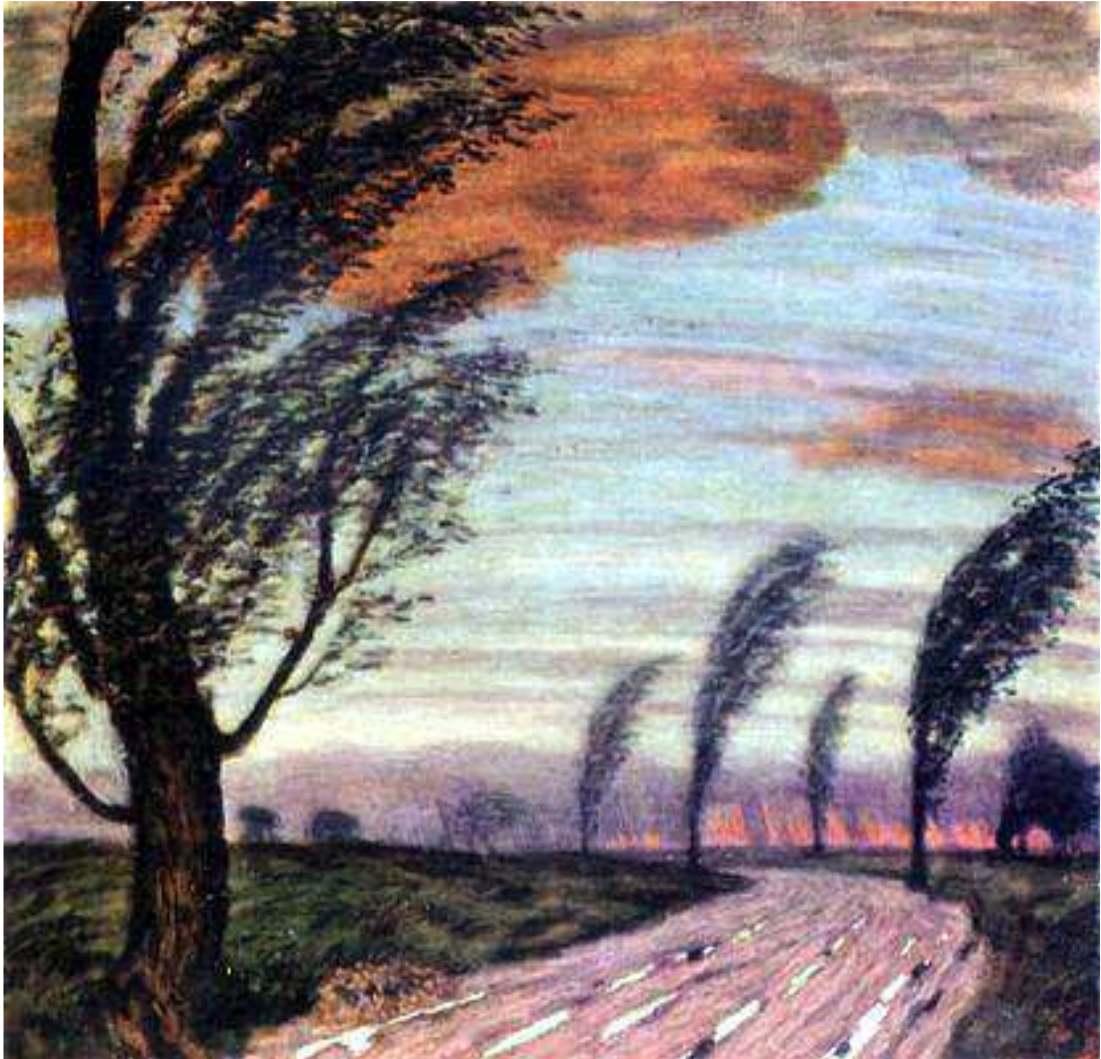
Franz von Stuck: „Sturm-Landschaft“