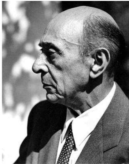
Schönberg in Los Angeles 1948

Niederschrift des nächsten Tones erst wieder Überlegungen anstellen muß, warum ich den einen oder anderen nicht verwenden kann oder sollte, lähmt dies in ganz gehörigem Maße den