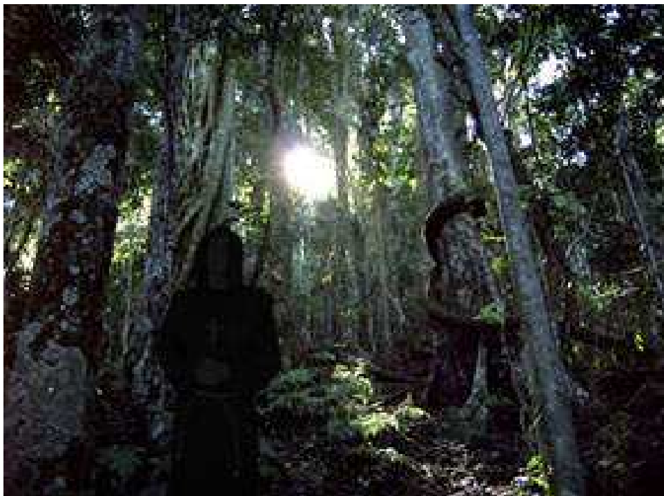
mitunter spukt's um Gurre...