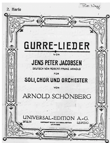
Cover der Stimme der 2. Harfe

3 Akten als op. 30/2 (UA: 1887 in Leipzig (Erstfassung); 20. März 1901 Hofoper Dresden (Zweitfassung)) - Teil III = „Odysseus' Heimkehr“ (Vorspiel: „Telemachos' Ausfahrt“) Musik-Tragödie 3 Akte op. 30/3 (UA: 12. Dezember 1896 Hofoper Dresden) - Teil IIII = „Odysseus' Tod“ (Vorspiel: „Telegonos' Abschied“) Musik-Tragödie 3 Akte op. 30/4 (UA 30. Oktober 1903 Hofoper Dresden))) (Bungert ist ein heute weithin unbekannter Komponist