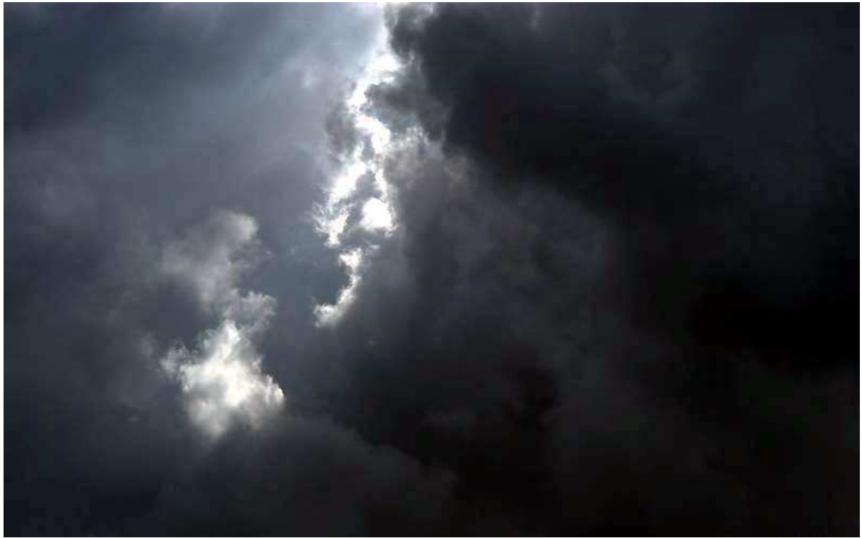
gleich erscheint Vol'mers „wilde Jagd“, das TeufelsHeer, am Himmel...