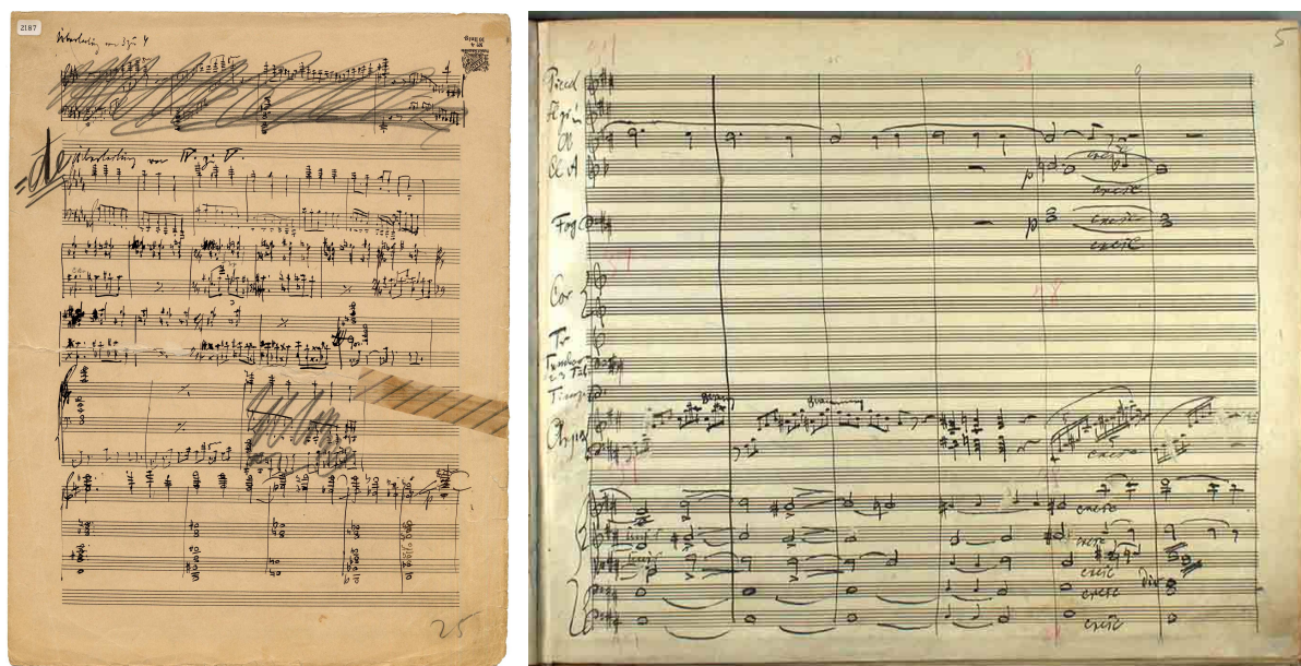
weitere Skizzen Schoenbergs zu seinen „Gurre-Lieder“n

nicht gesichert. Seine erste bekannte Komposition stammt von 1663, ein „Salve regina“ für Sopran, Violine, Gambe und Orgel. Die erste Anstellung erhielt er 1668 als Musiker der Hofkapelle und Kammerdiener bei Erzbischof Karl Liechtenstein-Kastelkorn zu Olmütz und Kremsier. Von einer Reise nach Innsbruck kehrte er unerlaubterweise nicht zurück. Auf dieser Reise kam er mit dem zu seiner Zeit berühmten Geigenbauer Jakobus Stainer in Kontakt, der ihn später in einem Schreiben als „der vortreffliche Virtuoso Herr Biber“ erwähnte. Ab 1670 trat er in den Dienst des Erzbischofs Max Gandolph Graf von Kuenburg in Salzburg. 1678 erhielt er dort die Stelle als Vizekapellmeister und nach dem Tode seines Vorgängers Andreas Hofer um 1684 die des Kapellmeisters. Er galt als genialer Violinvirtuose, und für sein kompositorisches Werk verlieh ihm Kaiser Leopold I. 1690 das Adelsprädikat „Truchseß“. Fortan durfte er sich „Biber von Bibern“ nennen, was in der damaligen Zeit einen sozialen Aufstieg bedeutete. Sein monatliches Einkommen betrug zu