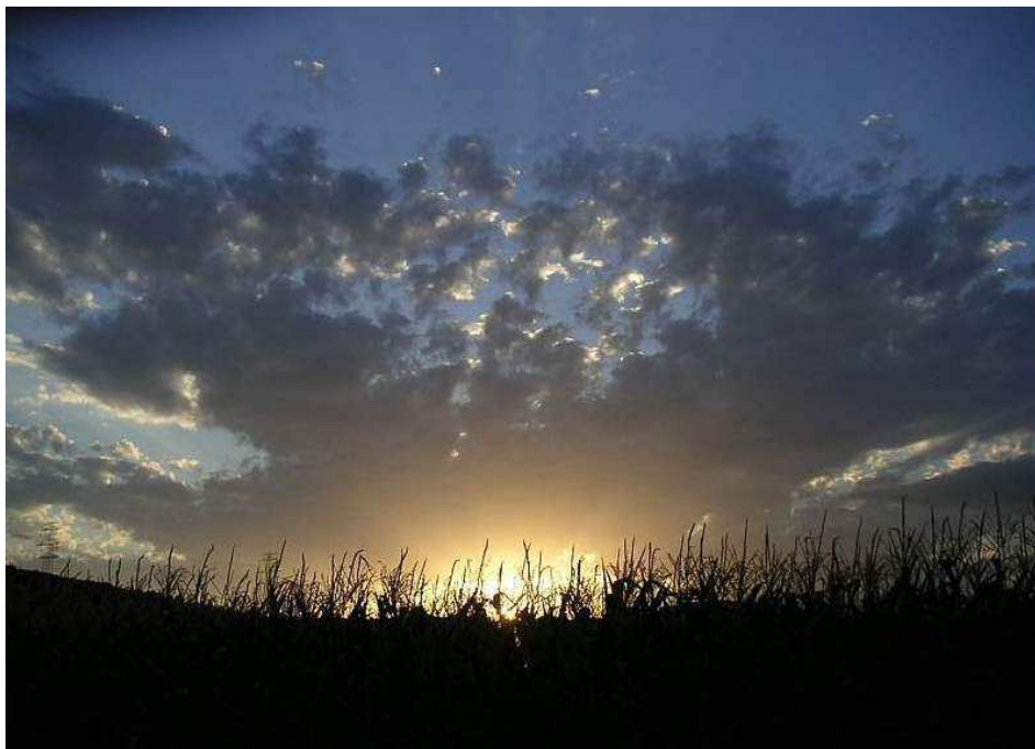
Abend um Gurre