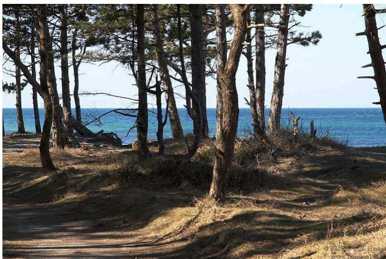
die Umgebung von Gurre dürfte eigentlich jedem Ostsee-Urlauber bekannt vorkommen...