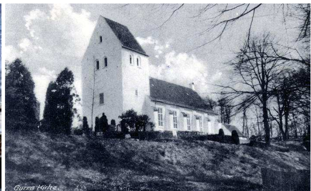
links: die Kirche von Gurre heute im Winter – rechts: die Kirche von Gurre früher im Herbst